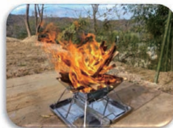
* 「林野火災予防対策関係の質疑応答集」(消防庁)から抜粋、作成