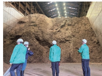
中国木材株式会社