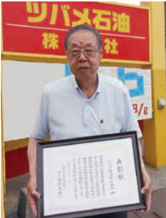
ツバメ石油株式会社様