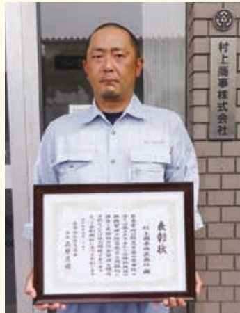
村上商事株式会社様