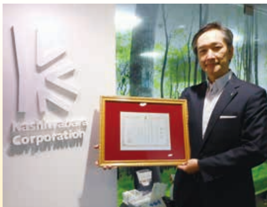
◎ 危険物優良事業所表彰 株式会社 カシワバラ・コーポレーション 様