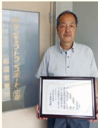
株式会社サンキュウ・トランスポート・ 中国 岩国営業所様