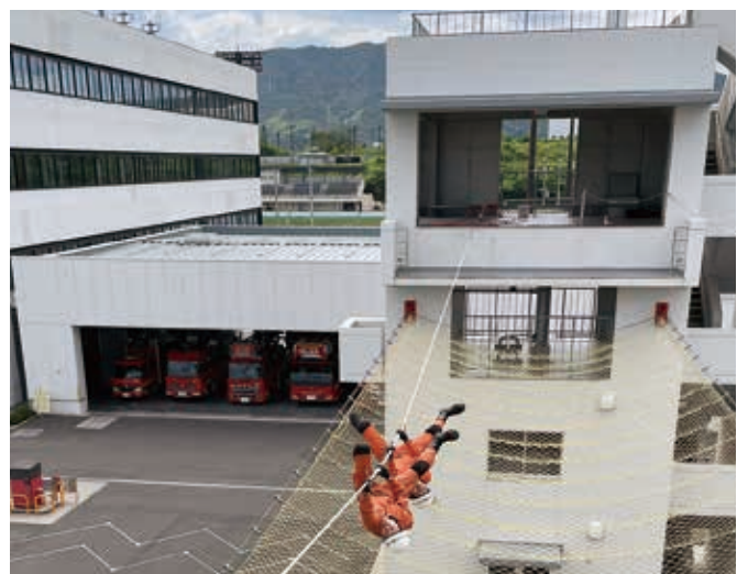
ロープブリッジ救出の部

令和4年7月20日に開催された中国地区消防救助技術指導会(参加隊員366人)に出場した岩国地区消防組合の団体種目5チーム、個人種目2人のうち、団体種目の3チームが上位入賞を果たし、東京都で開催される全国消防救助技術大会への出場権を獲得しました。