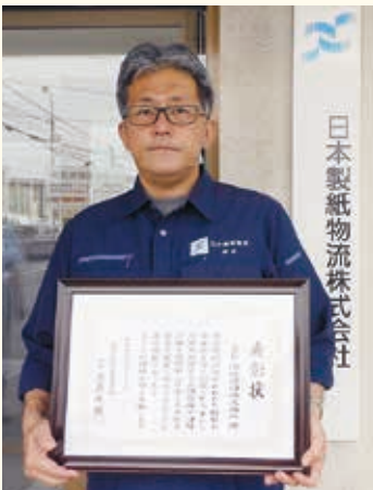
エヌピー運輸岩国株式会社様