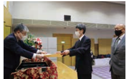
三井化学(株)岩国大竹工場 自衛防災組織