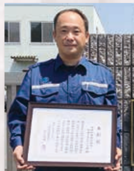
喜楽鉱業株式会社 周東エネルギー工房 様