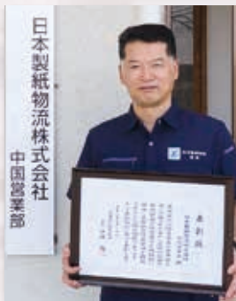
日本製紙物流株式会社 中国営業部