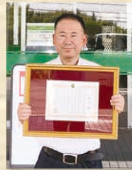
医療法人南和会 千鳥ヶ丘病院 様 ◎危険物優良事業所表彰