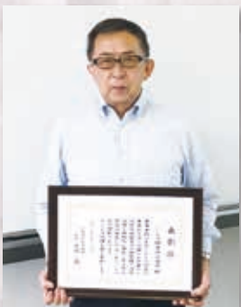
ニシモリ興産株式会社 様